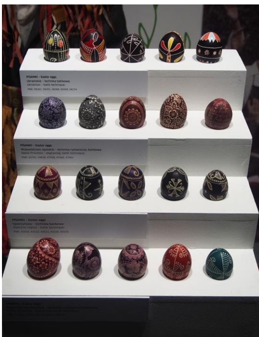
Muzeum Pisanki w Ciechanowcu

W kolekcji są pisanki "pisane" woskiem, malowane, oklejane kolorowym papierem, rdzeniem sitowia i kolorową włóczką, a nawet makiem i ziarenkami ryżu. Są pisanki z drewna lipowego, wytapiane i wykuwane, ażurowe - wykonane maszyną dentystyczną. Pisanki pochodzą z różnych regionów Polski, z Ziemi Huculskiej, Nowogródzkiej, ukraińskie, rosyjskie, czeskie, morawskie, z Chin, Japonii, Kenii i wielu innych krajów. Na koniec 2012 r. w Muzeum zgromadzono 1941 pisanek.