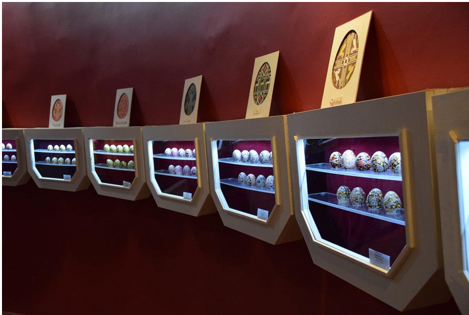
Muzeum pisanki w Ciechanowcu

W kolekcji są pisanki "pisane" woskiem, malowane, oklejane kolorowym papierem, rdzeniem sitowia i kolorową włóczką, a nawet makiem i ziarenkami ryżu. Są pisanki z drewna lipowego, wytapiane i wykuwane, ażurowe - wykonane maszyną dentystyczną. Pisanki pochodzą z różnych regionów Polski, z Ziemi Huculskiej, Nowogródzkiej, ukraińskie, rosyjskie, czeskie, morawskie, z Chin, Japonii, Kenii i wielu innych krajów. Na koniec 2012 r. w Muzeum zgromadzono 1941 pisanek.