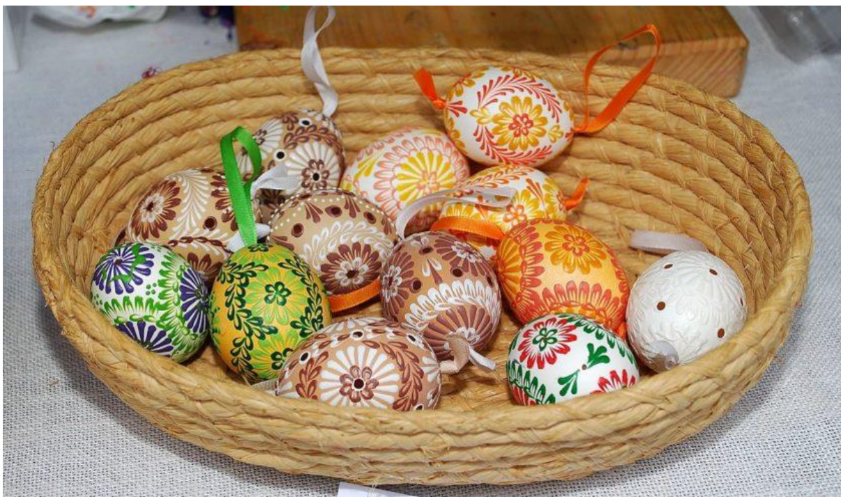
Pisanki batikowe (z użyciem wosku)